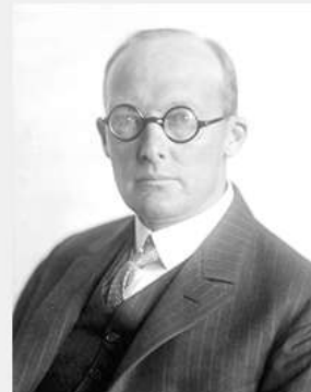
Holthusen, Hermann